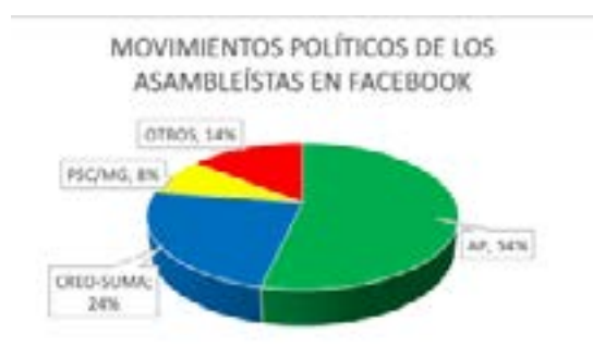
Figura 2. Movimientos políticos de los asambleístas que enlazan Facebook.

Facebook es la red en la que participa el mayor número de asambleístas ecuatorianos, 84 legisladores enlazan su perfil al sitio web de la Asamblea Nacional, de los cuales el 62% son hombres y el 38% mujeres. Por otra parte, existe paridad en la proporción de asambleístas hombres y mujeres que participan en esta red (62% de hombres y 60% del total de mujeres).