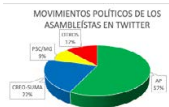
Figura 3. Movimiento político de los asambleístas que enlazan Twitter.

AP con 44 perfiles es el movimiento político que aporta con el mayor número de asambleístas en Twitter, seguido de CREO-SUMA con 17 asambleístas activos, ver Gráfico Nro. 3. Respecto del número de asambleístas por movimiento: AP tiene el 59% activos en Twitter, CREO-SUMA el 52% y PSC/MG el 50% de sus asambleístas.