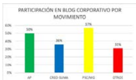
Figura 1. Participación en Blog Corporativo por movimiento político. Elaboración propia

Los 5 asambleístas que postean frecuentemente son de AP, que por otra parte tiene una